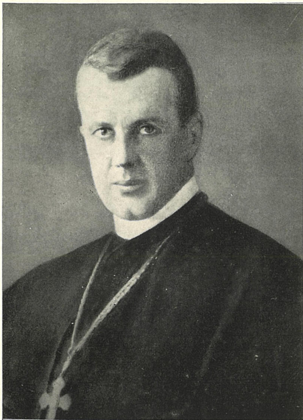
gr. Zichy Gyula a Pius alapítója.